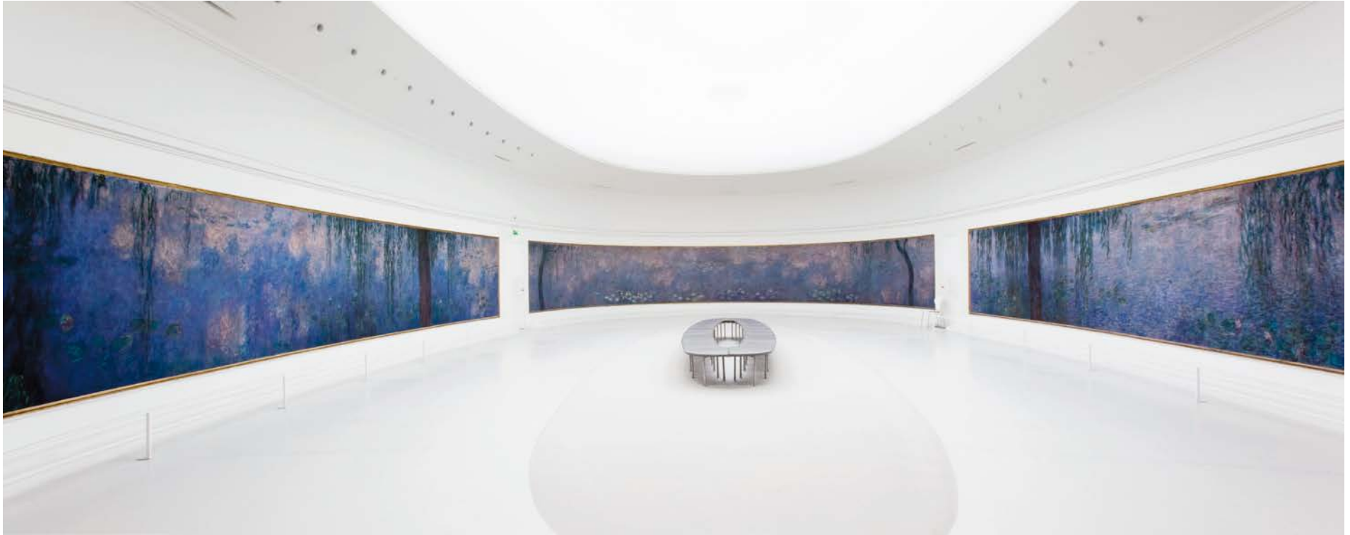
Claude MONET, Les nymphéas/L'ensemble de l'Orangerie (Détail - vue de la salle 1 des Nymphéas) , vers 1915-1926, huit panneaux exposés dans deux salles ovales de l'Orangerie, huile sur toile, hauteur : 2 mètres - longueur totale des huit panneaux : 91 mètres. Musée de l'Orangerie, Paris.