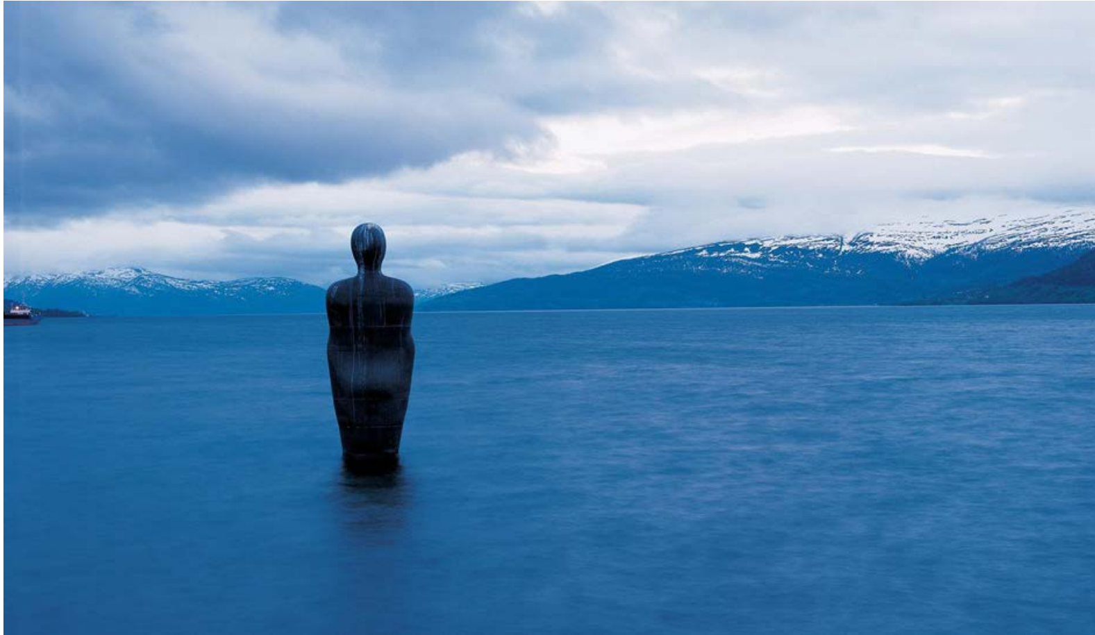
Antony GORMLEY, Havmann ou Havmanner (l'homme de la mer) , 1994, granit, H. : 10,15 mètres. Baie de Rana, Norvège.