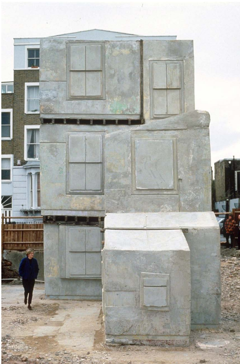
Rachel WHITEREAD, House , 1993 et détruite en 1994, moulage en béton de l'intérieur d'une maison, H. : 10 mètres. Londres.