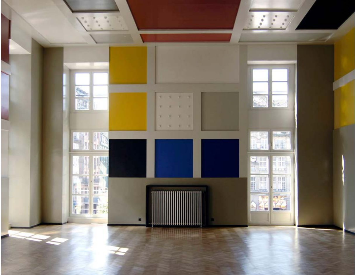
Sohie TAEUBER-ARP en association avec Jean ARP et Théo VAN DOESBURG (1883-1931), L'Aubette , entre 1926-1928, restructuration, aménagement et décors de divers espaces. Place Kléber, Strasbourg.